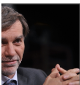
Delrio: incentivi per qualificare solo a