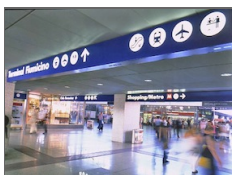
Roma Termini: realizzato parcheggio sopra i binari...