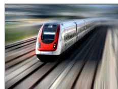
Grandi Stazioni, parte la privatizzazione di GS Re...