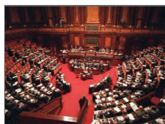
Ance, con nuovo Codice appalti si volta pagina di red